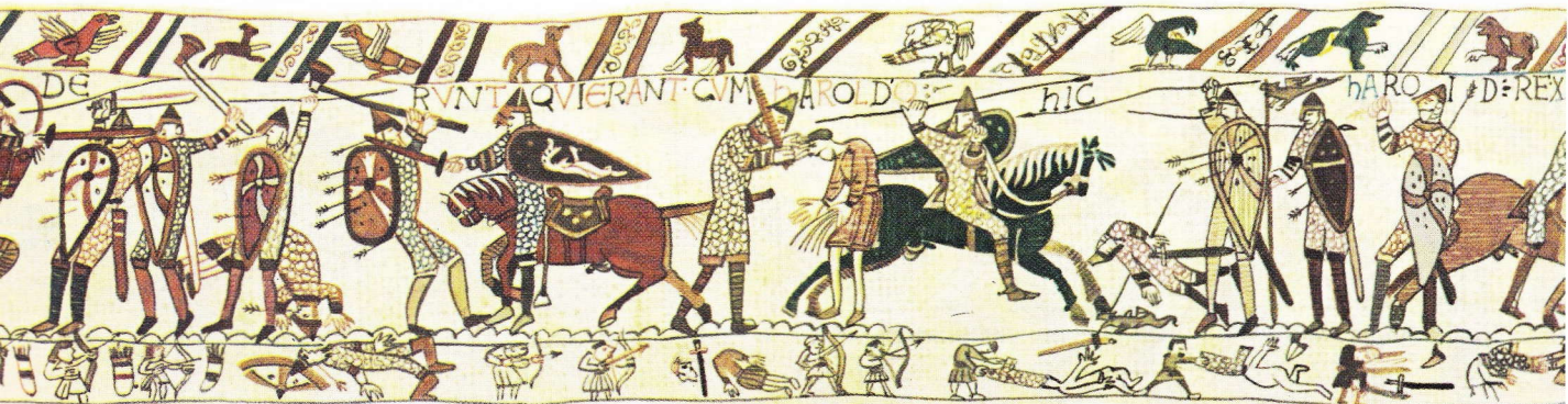
gedeelte van het wandtapijt van Bayeux

hij daarom de noordelijke kuststreek van het Karolingische rijk binnen. Hij bezette het land en eiste van de plaatselijke autoriteiten belangrijke geldsommen. Ofschoon hij ongetwijfeld ook de bevolking terroriseerde, kunnen we deze actie minder als een gewone plundering dan wel als een oorlog bestempelen, vermits er eveneens toch heel wat politieke belangen mee gediend waren. Een derde categorie tochten was werkelijk op kolonisatie gericht. Dit was het geval toen IJsland, Groenland en Normandië door Rollo werden veroverd. Ook Willem de Veroveraar, één van de opvolgers van Rollo, organiseerde in 1066 een expeditie naar Engeland.